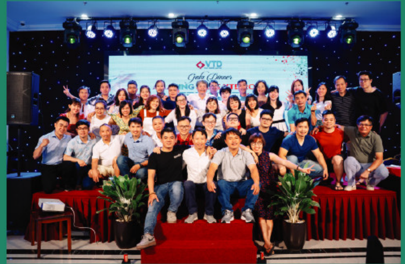
Đêm cuối của chuyến hành trình “Amazing Race – Speed Up” tại Quảng Bình, đại gia đình VTD đã có một đêm Gala dinner sum vầy ý nghĩa và ấm áp.