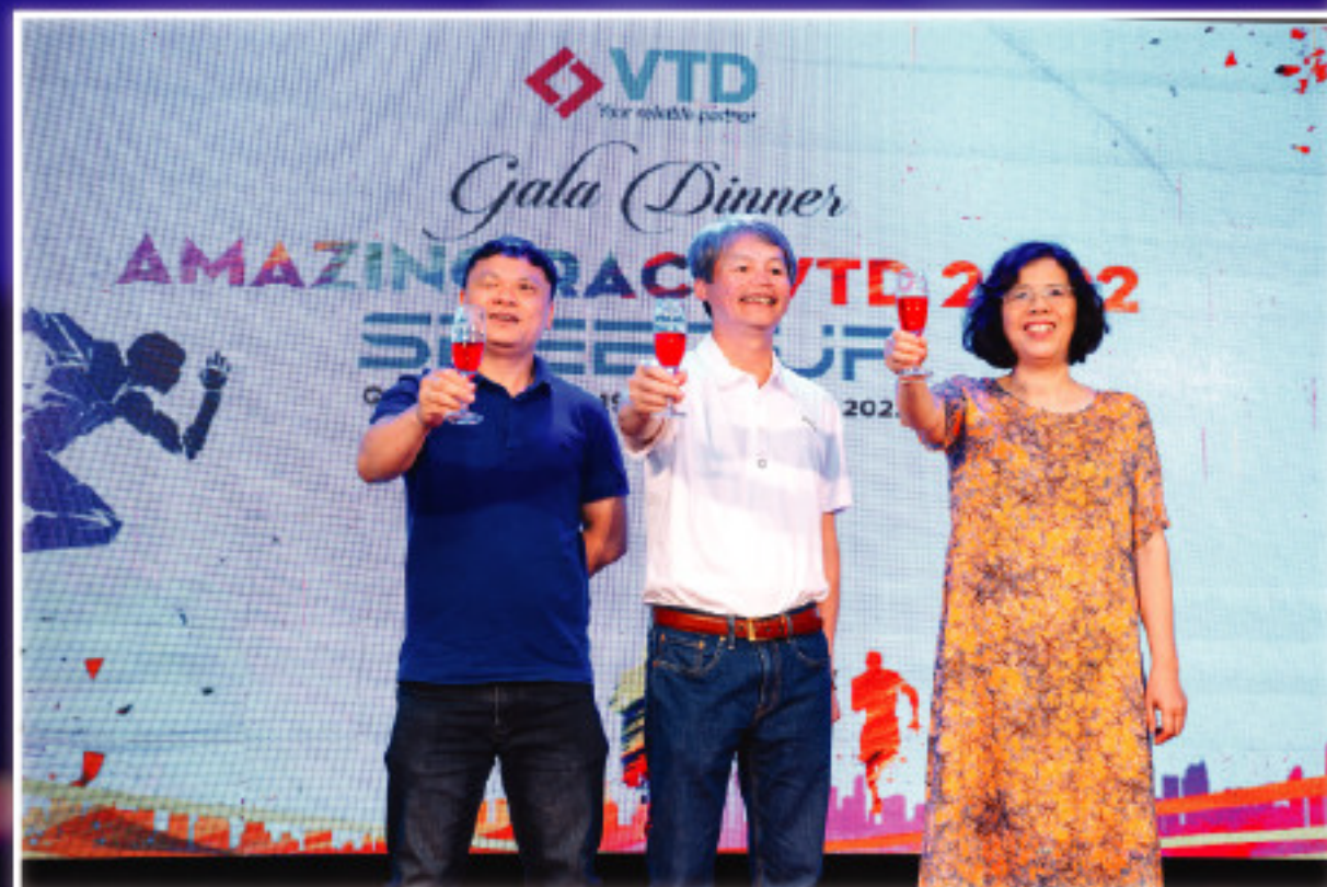
Đêm cuối của chuyến hành trình "Amazing Race - Speed Up" tại Quảng Bình, đại gia đình VTD đã có một đêm Gala dinner sum vầy ý nghĩa và ấm áp.

Người VTD bên nhau, cùng xem lại những khoảnh khắc đáng nhớ trong phần thi media - là góc nhìn về hành trình "amazing race" của các đội. Mỗi đội cử ra 01 thành viên phụ trách việc quay phim, chụp ảnh, ghi lại hoạt động và cảm xúc, chia sẻ của các thành viên trong đội trên suốt hành trình. Sau đó, cả đội sẽ cùng làm thành một sản phẩm đa phương tiện, clip giới thiệu về hành trình đó của đội mình.